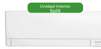
Unidad interior Split