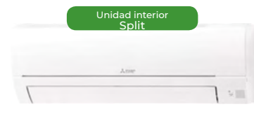
Unidad interior Split