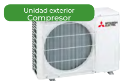
Unidad exterior Compresor