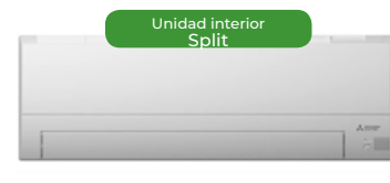
Unidad interior Split