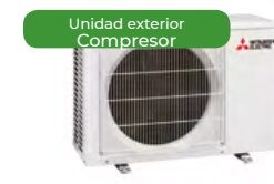
Unidad exterior Compresor