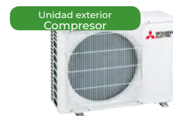
Unidad exterior Compresor